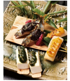
六甲みそ 田楽味噌詰合

【冬】京つけもの西利 古都の朝、福寿園 伊右衛門シリーズ缶詰め合わせ、 笹屋伊織 千客万来、豆政 京ごのみ 豆づくし