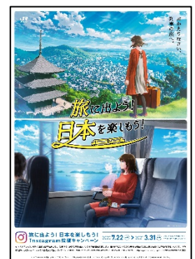
ポスターイメージ

JRグループ各社では、お客さまに安心して鉄道をご利用いただくために、新型コロナウイルス感染症対策に関する取組みを実施しています。詳しくは、各社のホームページをご覧ください。