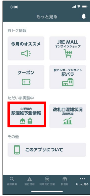
②「山手線内 駅混雑予測情報」をタップ