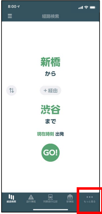
①「もっと見る」をタップ