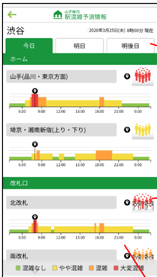
④駅の混雑状況を表示