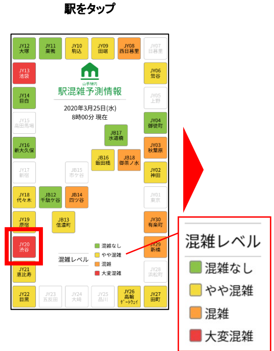
③各駅の混雑レベルを一覧表示