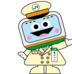
JR 東日本 横浜支社 マスコットキャラクター 「ハマの電ちゃん」