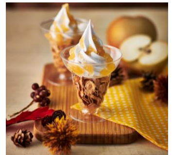
多摩川梨ジャムのサンデー