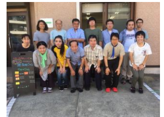
「はっぴわーく」のみなさん

一般企業等での就労が困難な方に、働く場を提供するとともに、就労への移行に向けた知識及び能力の向上のために必要な訓練を行っています。「働きたい」というニーズの充足及び生活の充実を目的に活動し、作業や就労に関する学習会など働く場・就労へのステップアップの場としての機能を果たしています。