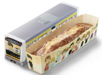
多摩川梨ジャムの トレインパウンドケーキ