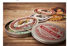
【ラベルコースターセット】