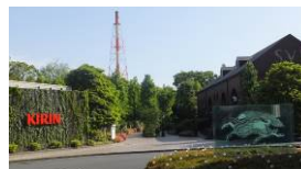
【麒麟ビール横浜工場】