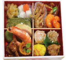
【特製おつまみセット】 (Night Beer コース)