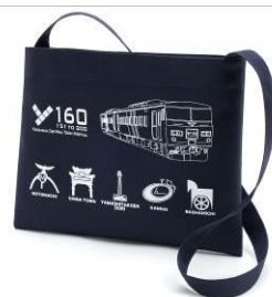
Y160オリジナル キタムラ ショルダーバッグ

元町ブランド(洋服は「フクゾー」、靴は「ミハマ」、バッグは「キタムラ」、アクセサリは「スタージュエリー」、「ボンパドゥル」のパンのコスチュームで着飾ったマスコットガールです。