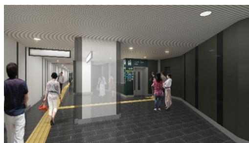
国際フォーラム口・京橋口と中央口・中央西口の 改札内を結ぶ新設通路(イメージ)