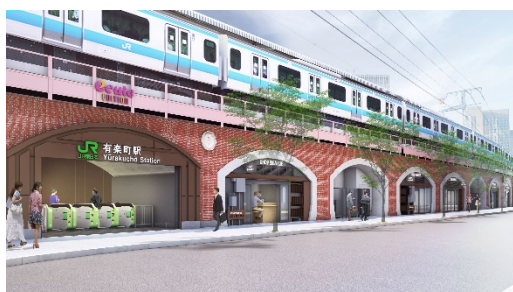
駅外観(国際フォーラム口)(イメージ)