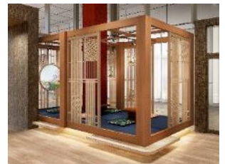
日本文化体験コーナー(イメージ)