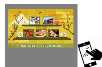
大型ビジョン表示画面(イメージ)

楽天グループのインターネット研究を応用したデジタルサイネージコンテンツ「WallSHOP」の技術を活用し、お客さまが大型ビジョン画面と手元のスマートフォン等のデバイスを連動させ、楽しみながら「地域の旅情報」を探ることができます。インタラクティブな仕掛けを通じ、ゲーム感覚で旅の情報を収集する、本施設でしかできない新しい体験をご提供します。