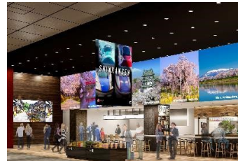
イベント装飾(イメージ)