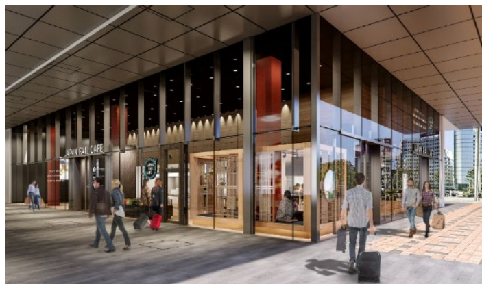
施設外観(イメージ)

営業時間 8:00~22:00(土休日は8:00~21:00 旅行カウンターは全日8:00~16:00)