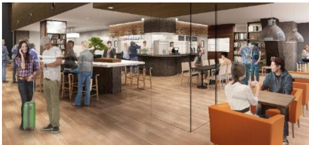
飲食スペース(イメージ)