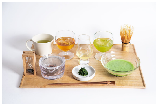
煎茶堂の緑茶 5 種飲みくらべ

時間帯ごとに提供する食事に合わせ、日本茶の楽しみ方をご提案します。“地域”の特色や生産者の顔が見えるよう、ブレンドせずに仕上げたお茶や、お茶を使用した当店限定オリジナルカクテル各種を提供します。また、和を感じる洗練された茶器を使い日本茶を淹れる体験や飲みくらべもお楽しみいただけます。