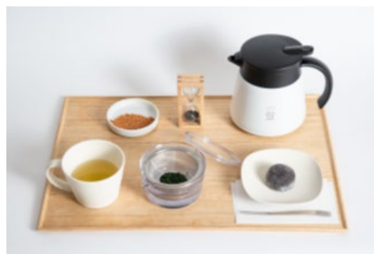
急須で入れるティーペアリング