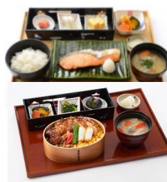
飲食メニュー(イメージ)