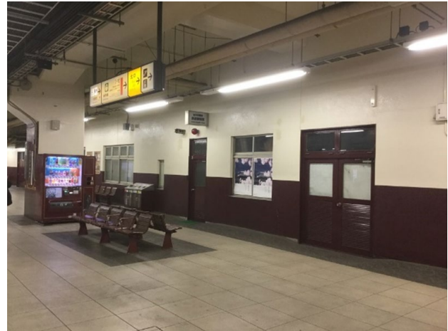
現行の宇都宮駅日光線ホーム（5番線）