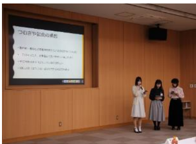
提案発表会の様子（昨年度）

今年度は大宮駅で12月1日に実施する新商品お披露目イベントに向けて、新商品の認知度向上施策や商品説明リーフレットの企画・制作などをカリキュラムの中で検討。学生が企画した商品プロモーションを12月1日のイベントで学生自ら取り組む。