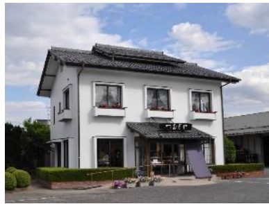
つむぎや 栗橋本店

大正元年、小麦粉の製粉工場として創業。埼玉県産小麦粉にこだわり、うどん、そばをはじめ、だし・つゆ、小麦粉菓子まで、小麦粉とゆかりのある50種類を超える品物を取り揃える。「こ、ふいなんしえ」には埼玉県産あやひかりを100%使用。