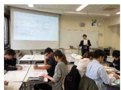
つむぎやによる講義（今年度）