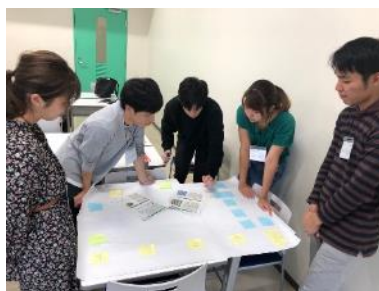
グループワークの様子（今年度）