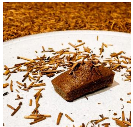
こ、ふいなんしえ かさねほうじ茶味