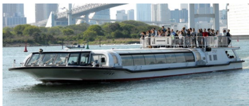
東京都公園協会「東京水辺ライン(こすもす等)」