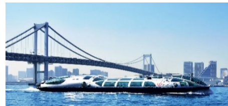
東京都観光汽船「TOKYO CRUISE(ヒミコ)」