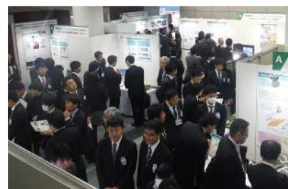
鉄道技術フォーラム会場の様子