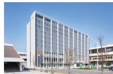
JR 東日本ホテルメッツ 新潟