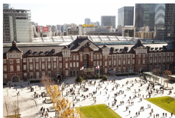
東京ステーションホテル