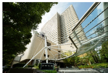
ホテルメトロポリタン