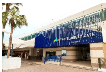
ホテルドリームゲート舞浜