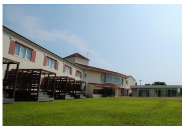
ホテル ファミリーオ館山