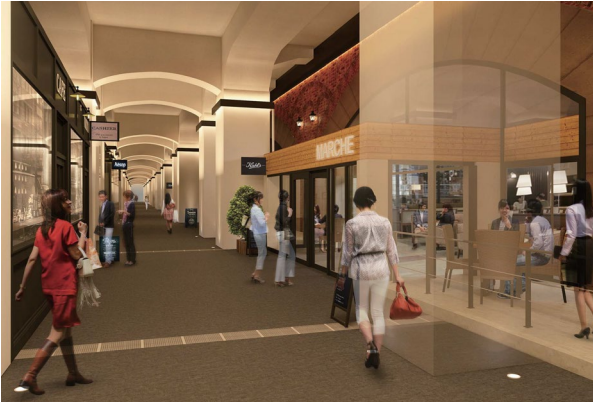
【内部通路イメージ】