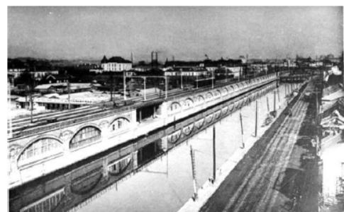
【完成当初の煉瓦アーチ高架橋】