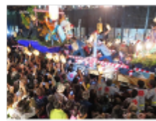
角館祭りのやま行事

能代には伝統的な七夕行事があり、かつて運行されていた18mほどの城郭型灯籠が1世紀の時を超えて平成25年に復活しました。日本一の高さを誇る24mの灯籠を加えた巨大な2基の灯籠が、太鼓やお囃子とともに能代のまちを鮮やかに彩りながら練り歩く様をご覧ください。