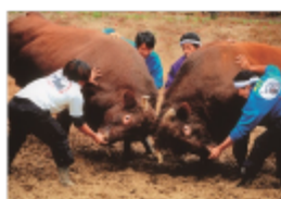
山古志「牛の角突き」

新潟：小千谷/小千谷「牛の角突き」(8/3出発) 長岡/山古志「牛の角突き」(9/7出発)