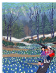
原田泰治 [水バシャウ] 1963年