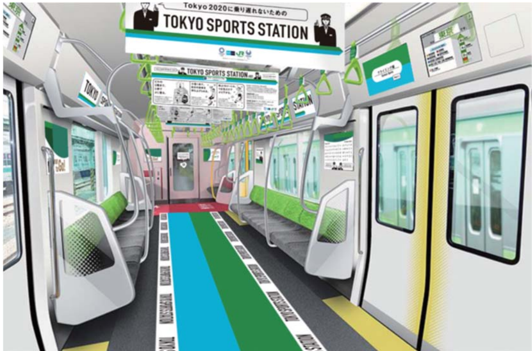
中吊りポスターイメージ