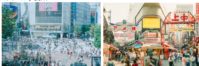
東京カルチャーイメージ