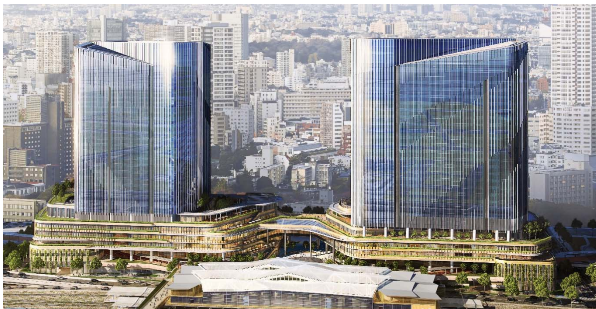
【4街区パース】 港南側から4街区(南棟および北棟)を望む