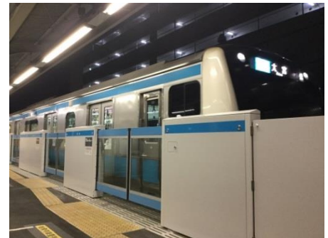
ホームドアイメージ (写真は鶴見駅)