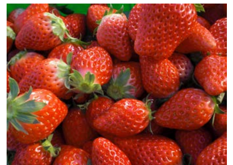
サイズが大きく、甘みの強い静岡生まれの「紅ほっぺ」