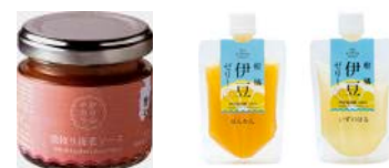
「殻絞り海老ソース」・「伊豆柑橘ゼリー」 柑橘ゼリーは新たに2品種加わりパワーアップ!