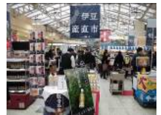
前回のJR上野駅での開催の様子