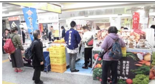
前回のJR横浜駅での開催の様子