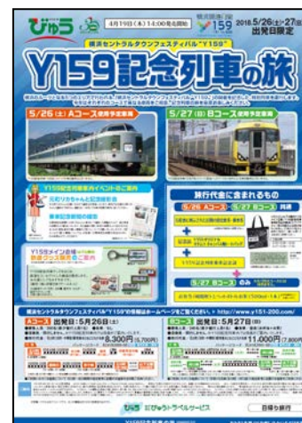
パンフレットイメージ