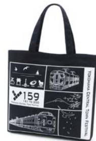
Y159オリジナル キタムラ キャンバス地トートバッグ