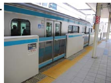
ホームドア（写真は桜木町駅）