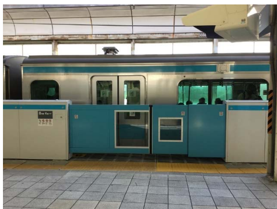
多段式ホームドア（写真は桜木町駅）

東神奈川駅には、京浜東北・根岸線の10両編成と横浜線の8両編成の車両が停車するため、一部の車両でドア位置が異なります。そのため、8号車（横浜方）付近に従来よりも広い開口幅に対応したホームドア（多段式）を桜木町駅に続き導入いたします。