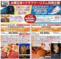
クラブツーリズム(株)