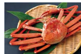
富山県産 高志の紅ガニ まるごと 1 杯