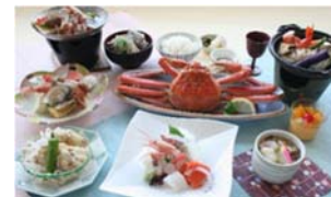
ホテルこうしゅうえん ずわい蟹付き夕食

※旅行代金は、おとなおひとり様の代金です。 ※旅行商品によっては、売り切れの場合がございます。あらかじめご了承ください。 ※旅行商品の行程等は、2018年11月28日現在の予定で、変更となる場合もあります。 ※各旅行商品の内容は、各旅行会社のホームページをご確認いただくか、又は各旅行会社へお問い合わせください。 ※写真はすべてイメージです。