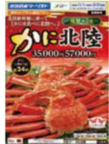
(株)近畿日本ツーリスト首都圏