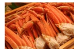
夕食バイキング「カニ」