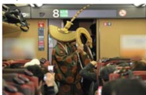
こきりこささら踊り