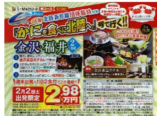
(株)JTBメディアリテリング