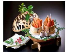
加賀屋別邸松乃碧 「極上蟹会席」