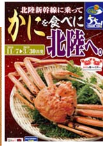
ビッグホリデー(株)