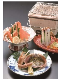
「石川産ブランド加能蟹極上会席」