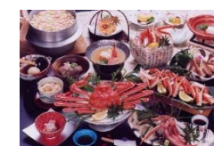
清風荘 「かに尽くし会席（夕食）」