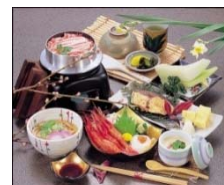
「2日目昼食 炊きたてカニ釜飯御膳」