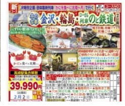
(株)タビックスジャパン