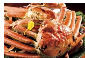
「タグ付き越前ガニ」 (2人前)