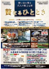
(株)びゅうトラベルサービス

(株)びゅうトラベルサービス、(株)日本旅行、(株)JTB、(株)JTBメディアリテリング、 (株)近畿日本ツーリスト首都圏、クラブツーリズム(株)、(株)阪急交通社、(株)読売旅行、(株)農協観光、 ビッグホリデー(株)、(株)タビックスジャパン