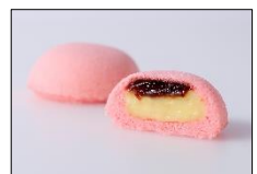
【「御用邸の月 完熟とちおとめ」】

※各イベントの内容は、予告なく変更となる場合があります。なお、本リリースの画像は、すべてイメージです。