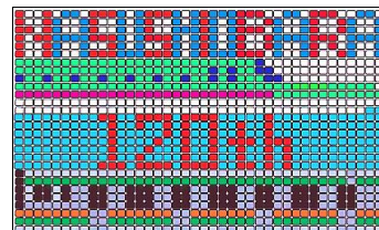
【エコキャップアート図柄】