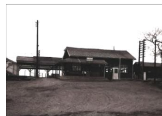
【1966年(昭和41年)頃の東那須野駅】