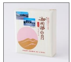
【限定パッケージ】 JR 東日本商品化許諾済