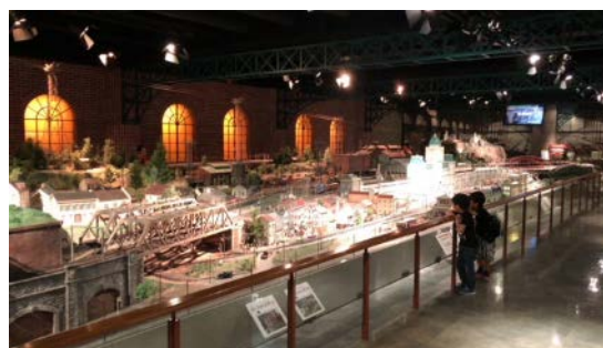
※世界最大級の一番ゲージジオラマ「いちばんテツモパーク」