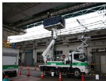
高所作業車 乗車体験