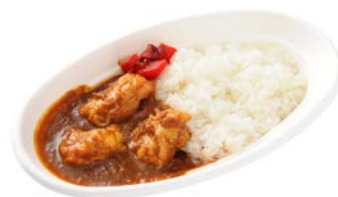
懐かしの食堂車カレー