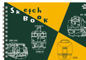
オリジナルスケッチブック