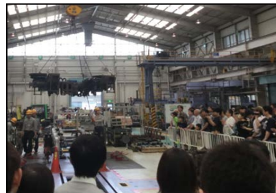
車両メンテナンス作業実演