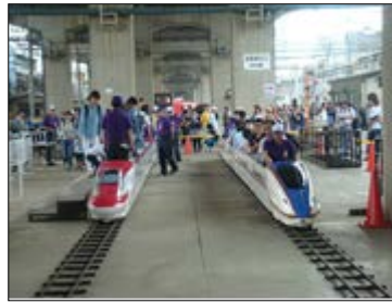
ミニ新幹線（写真は、E6、E7系）