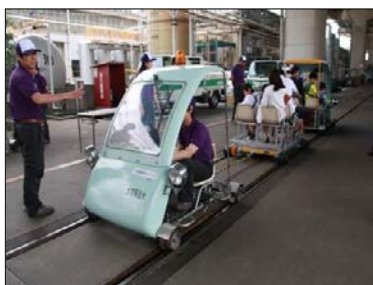
レールスター 乗車体験

工事用車両（レールスターや高所作業車）の乗車体験、実際の車両を使用しての業務体験などがあります。