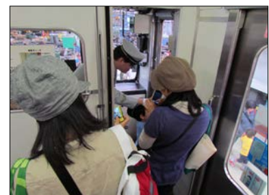
業務体験（車掌体験）