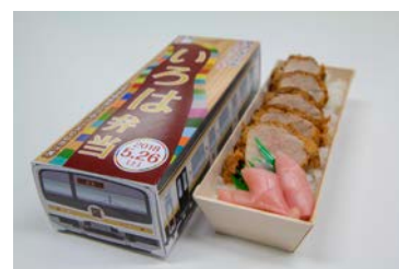
いろは弁当 1,000円（税込）