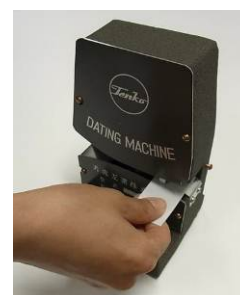
ダッチングマシン