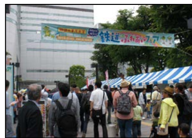
鐘塚公園会場風景