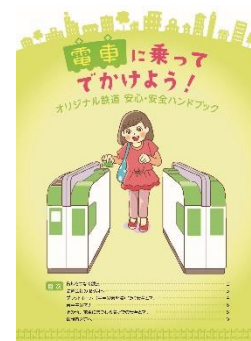
ハンドブックイメージ