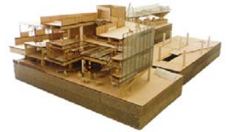
展示模型（イメージ）

山手線の 1 2 の駅について、少し未来の暮らしの一部となる「あさって」の駅の姿を、詳細に作り込まれた迫力ある建築模型に表現します（1/50 スケール）。