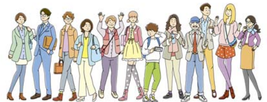
イラスト（イメージ）

“「あさって」の駅”を利用する、“「あさって」の人びと”を想像しました。イラストで描かれた 1 2 人が、等身大で、来場者を出迎え、それぞれの“「あさって」の駅”に導きます。駅員や整備士、駅長など、“駅の人びと”も、等身大の人型になり、来場者を出迎えます。