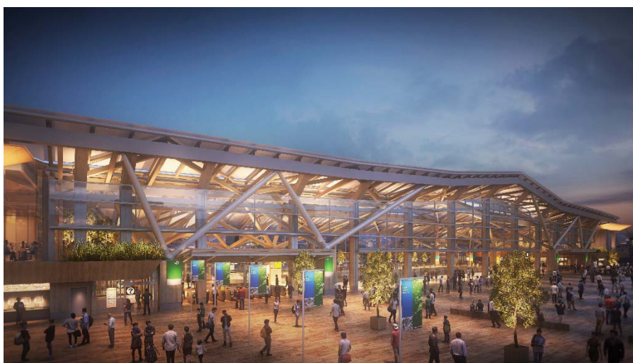
【街区側外観イメージ図：街のランドマークとなる暖かな光の駅舎】

代表作:JR 東京駅丸の内駅舎保存復原ライトアップ、東京国際フォーラム、JR 京都駅、六本木ヒルズ、シンガポール国立博物館、ガーデンズ バイザ ベイ、アマン東京などの照明計画を担当。