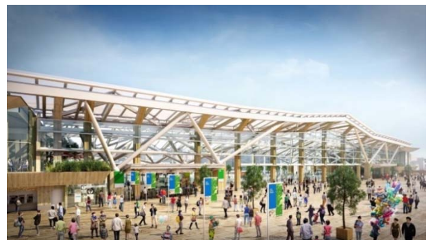
【街区側外観イメージ図】