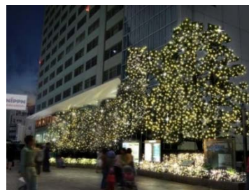
新宿サザンテラス