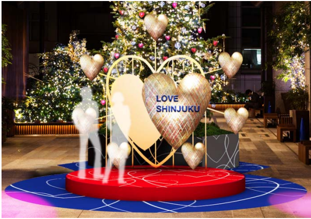
タカシマヤ タイムズスクエア

新宿サザンテラスでは、ビッグフラワーが咲き誇る「ビッグフラワーパーク」を実施いたします。大きな花の中に座ってカラフルな周囲の花々に囲まれながら、写真をお撮りいただけます。タカシマヤ タイムズスクエアでは、「Heartシリーズ」を製作し続けるアーティスト・西村公一氏監修の“ハート”をモチーフにしたオブジェが登場いたします。Suicaのペンギン広場では、シャンデリアで飾ったSuicaのペンギン像や、リングの重なりをイメージしたシンボルツリーなど、SNS映えするスポットをお楽しみいただけます。