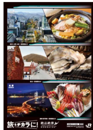
【キャンペーンポスター(イメージ)】

駅貼りポスター、車内中張りポスター、新幹線車内誌、トレインチャンネル等での宣伝展開を実施するとともに、「えきねっと」・「モバイルSuica」のインターネット限定のおトクなきっぷ(50%割引)をPRするために、東北エリアにてTVCMを実施します。