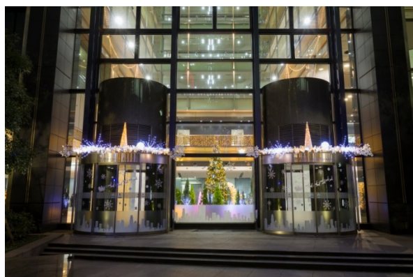
新宿メインズタワー