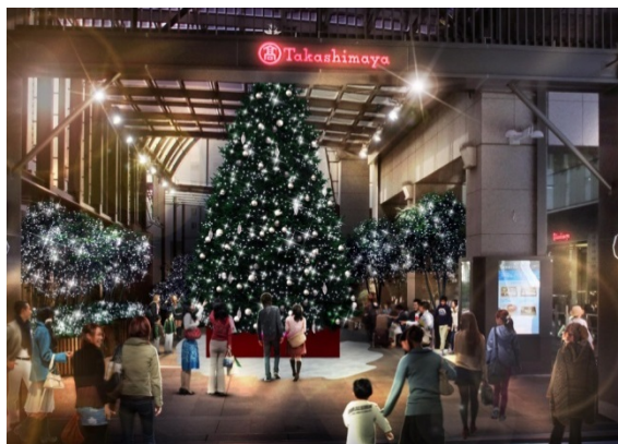
タカシマヤ タイムズスクエア