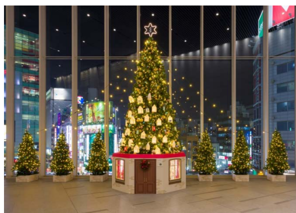
JR 新宿ミライナタワー