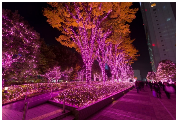
新宿サザンテラス