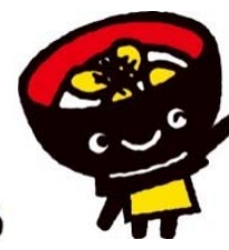
岩手県 わんこきょうだい・うつつ