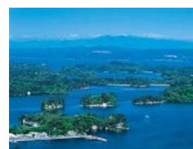
大高森展望台から望む松島湾の島々 (宮城県東松島市)