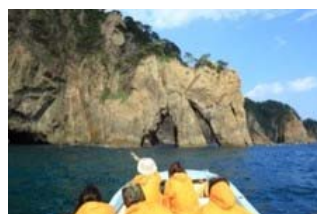
サップ船 (小型の磯船) アドベンチャー (岩手県田野畑村)

三陸エリアの各市町村協力のもと、味覚が満載の三陸をご紹介します。各地を走るイベント列車や旅行商品など、おでかけ情報が満載です。さらに、かわいいご当地キャラクターも登場し、会場全体を盛り上げます。お子さまから大人まで、沿線の雰囲気や魅力に触れていただけます。