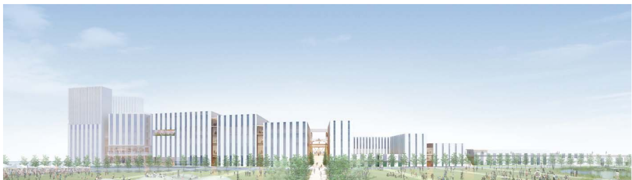
多摩川方面より (イメージ)