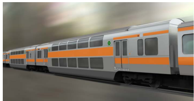
中央快速線グリーン車イメージ