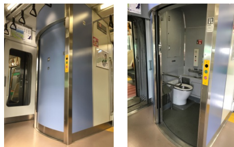
普通車トイレイメージ