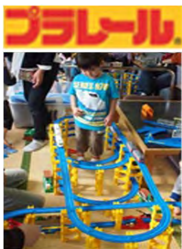
お座敷プラレール号車内