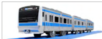
プラレール「E233系京浜東北線」