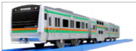
プラレール「E233系湘南色」