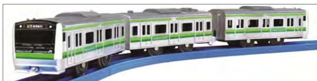
プラレール「E233系横浜線」