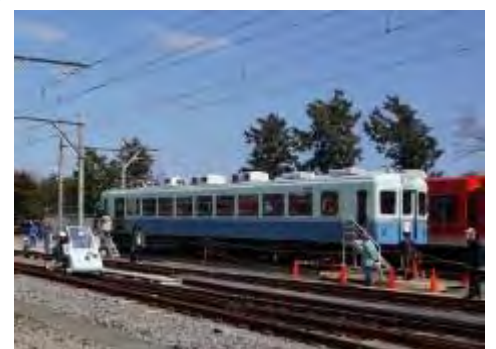
「伊豆急でんしゃまつり」での ATカート乗車体験