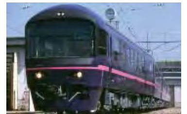
485系お座敷列車「華」 お座敷プラレール号