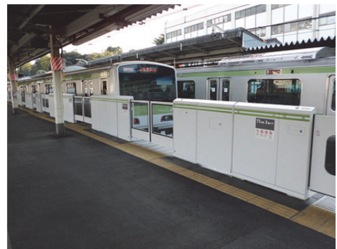
ホームドアイメージ