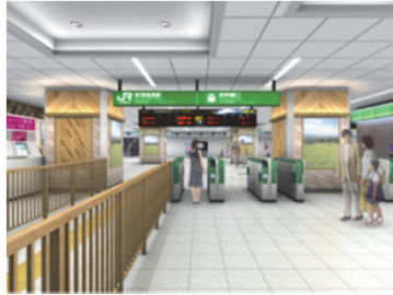
(7) 新幹線改札口の移設