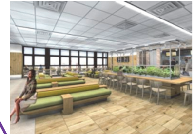
(4) 改札外待合室改良