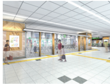
(6) みどりの窓口改良