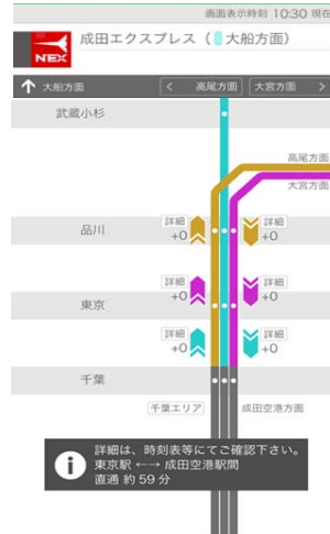
列車名、現在位置、遅れ時分