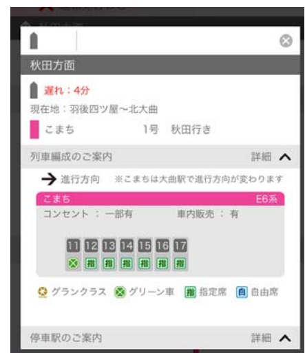
車両に関する情報