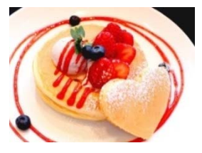
とちおとめのベリーベリー コラソパンケーキ