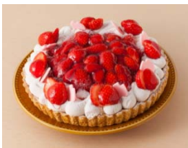
栃木県産とちおとめの 和風タルト