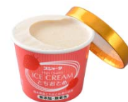
とちおとめ いちご アイスクリーム