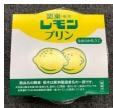
関東・栃木 レモンプリン