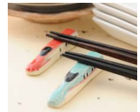
E5系・E6系 益子焼き 箸置きセット