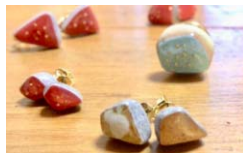
益子焼アクセサリ