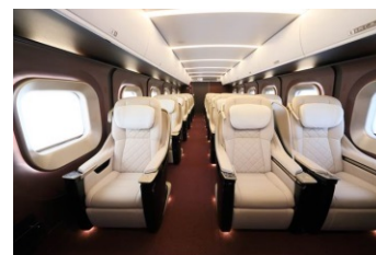
E7系グランクラスシート (イメージ)

※1 平日・休日出発限定：休前日にあたる土曜日、休日の前日にはご出発いただけません。