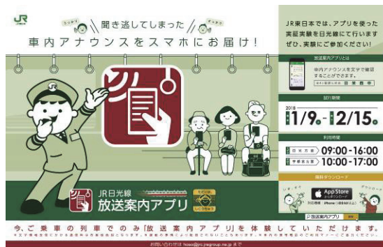
【中吊り広告（日本語）】