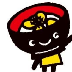
岩手県 わんこきょうだい・うにつち