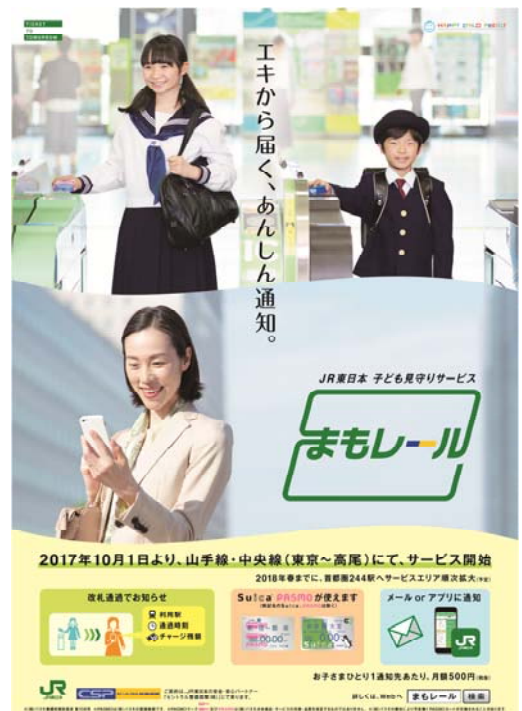
「まもレール」イメージポスター