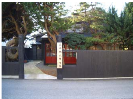
1 旧三上家住宅改修事業