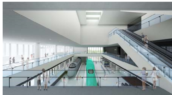
新館外観・内観(イメージ)