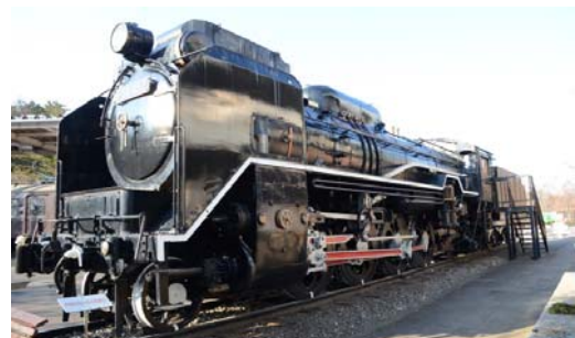
展示車両 (D51 形蒸気機関車)