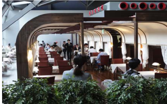
トレインレストラン日本食堂

(食堂車をテーマとした、鉄道博物館に今まで になかったフルサービスのレストラン)