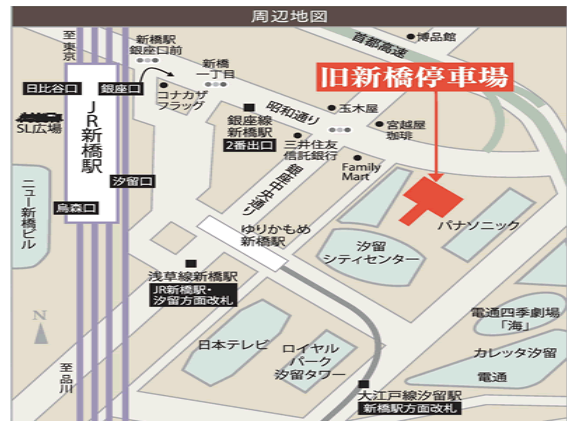
旧新橋停車場及び案内図