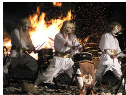
14 白面金毛九尾狐太鼓修理修繕事業