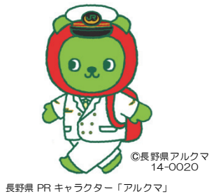
長野県 PR キャラクター「アルクマ」