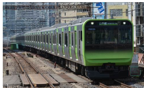
山手線 E235 系通勤形車両