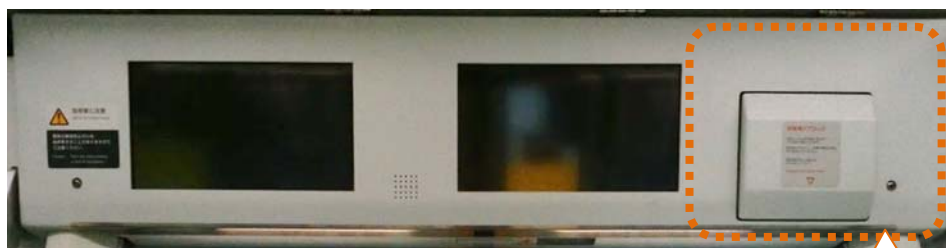
ドア上部設置イメージ