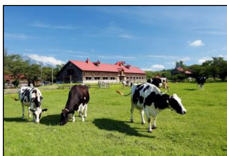
【小岩井農場の牛の暮らし (イメージ)】