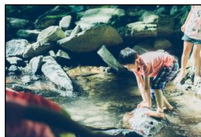
【モリウミアスでの一コマ (イメージ)】