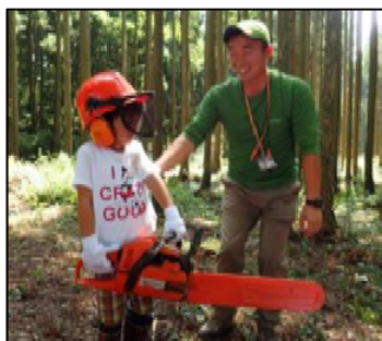
【林業体験 (イメージ)】

一度は乗りたい寝台列車「カシオペア号盛岡行き」に乗って雫石・小岩井へ。国の重要文化財に指定された施設がある小岩井農場で、100年以上にわたり育み続けた山林で、親子で林業体験や隠れ家づくり、沢遊びや山菜採り、イワナつかみにチャレンジしていただけます。さらに、小岩井農場施設内の「国の重要文化財」特別見学ツアー等へご案内します。