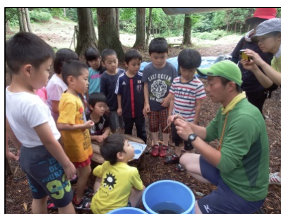
【イワナつかみ (イメージ)】