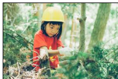
【森のプログラム (イメージ)】

石巻市の雄勝で暮らす人々とふれあい、暮らしと自然が共存する環境を肌で感じて学ぶ「モリウミアス」。ここで3日間を過ごし、木の伐採や植樹のほか、ホヤ貝等の水揚げなどの体験や、畑作業や夏野菜の収穫体験等をしていただきます。