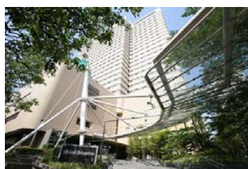
ホテルメトロポリタン