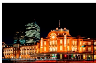
東京ステーションホテル