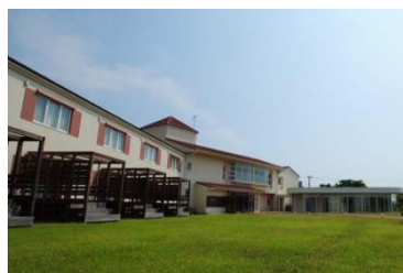
ホテル ファミリーオ館山