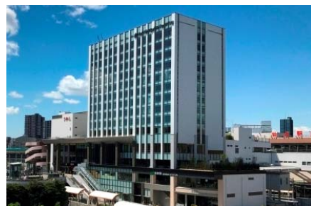
ホテルメトロポリタン仙台イースト