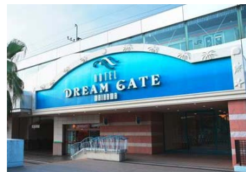
ホテルドリームゲート舞浜