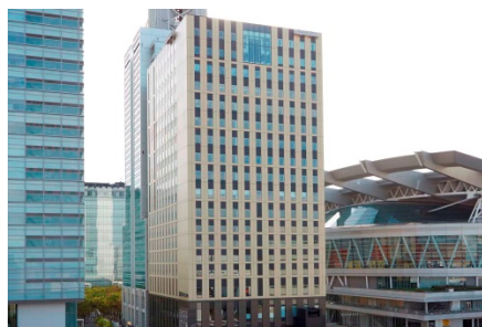
ホテルメトロポリタンさいたま新都心