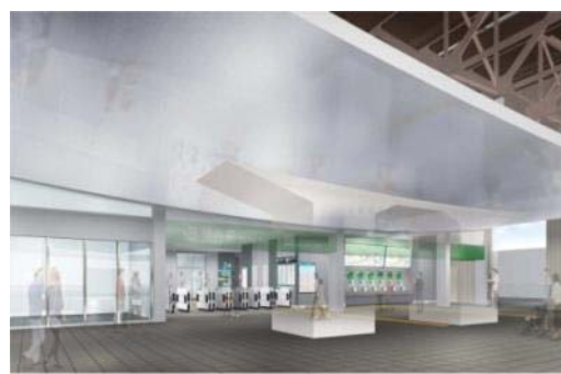
全体開業時の新改札イメージ (視点②)