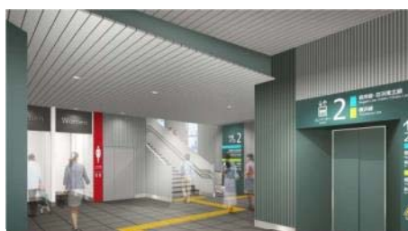
改札内から見た構内イメージ (視点①)