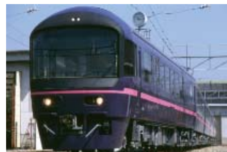
485系お座敷列車「華」 お座敷プラレール号