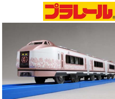
プラレール「IZU CRAILE (伊豆クレイル)」