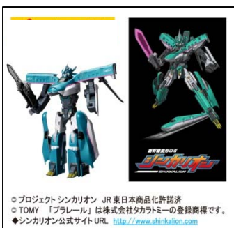
◎プロジェクト シンカリオン JR 東日本商品化許諾済 ◎TOMY 「プラレール」は株式会社タカラトミーの登録商標です。 ◆シンカリオン公式サイト URL http://www.shinkalion.com