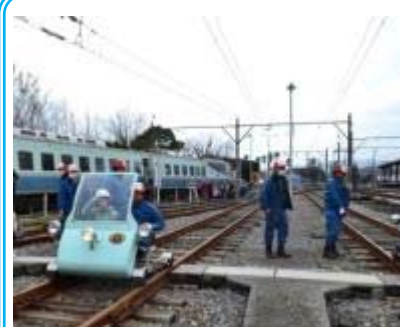
「伊豆急でんしゃまつり」での ATカート乗車体験