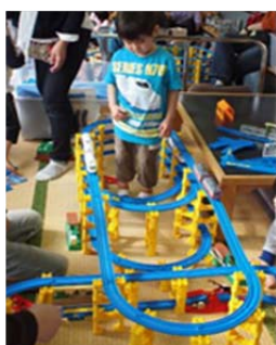
お座敷プラレール号車内